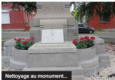
Nettoyage au monument...