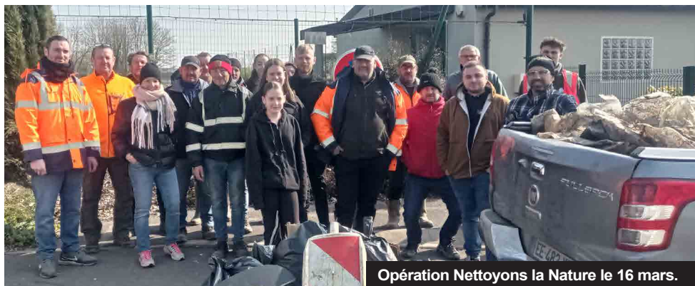
Opération Nettoyons la Nature le 16 mars.