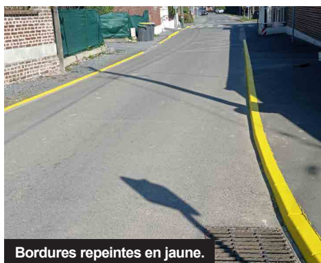
Bordures repeintes en jaune.