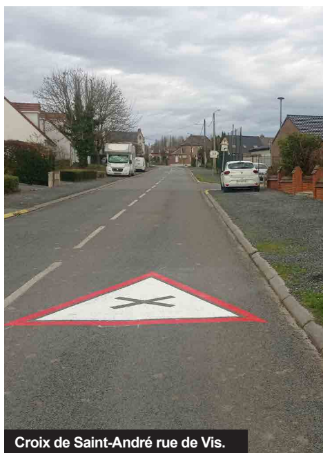
Croix de Saint-André rue de Vis.