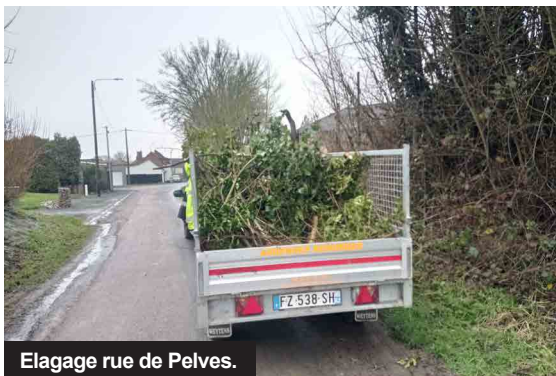
Elagage rue de Pelves.