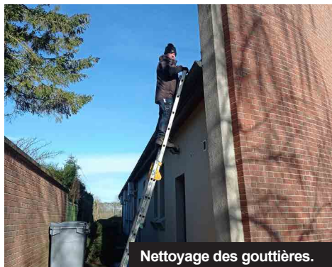
Nettoyage des gouttières.