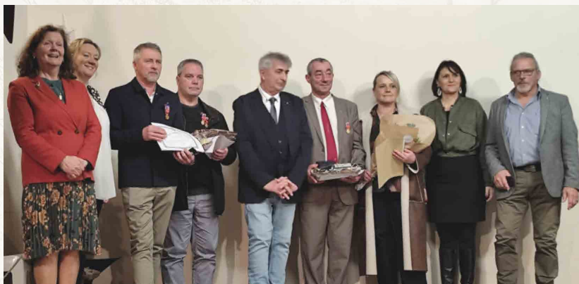
Remise de médailles à quatre récipiendaires aux Vœux de janvier 2025.

vous présentent leurs Vœux les meilleurs pour l'année 2026