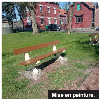
Mise en peinture.