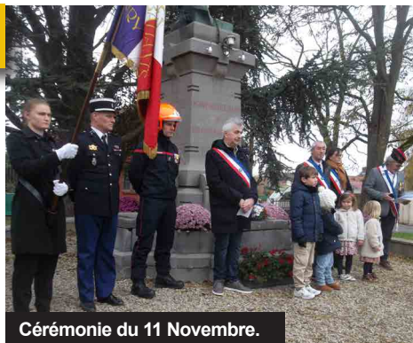
Cérémonie du 11 Novembre.