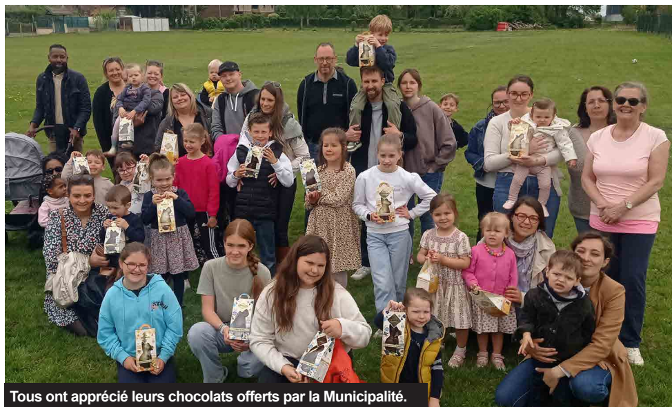
Tous ont apprécié leurs chocolats offerts par la Municipalité.

L'animation fut une belle réussite... Tous les œufs ont été ramassés et chaque enfant présent est reparti avec son chocolat. Le pot de l'amitié a clôturé cette matinée.