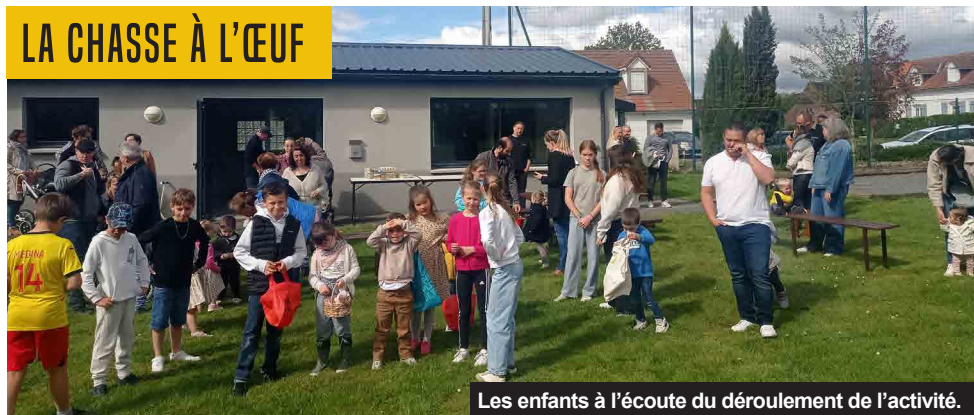
Les enfants à l'écoute du déroulement de l'activité.

Lundi 21 avril ... Les familles ont été accueillies sur la pelouse du stade pour la fidèle chasse à l'œuf. Les enfants ont pris plaisir à participer à un loto géant. Ils devaient reconstituer leur boîte avec les motifs indiqués.