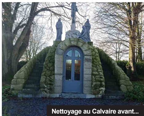
Nettoyage au Calvaire avant...