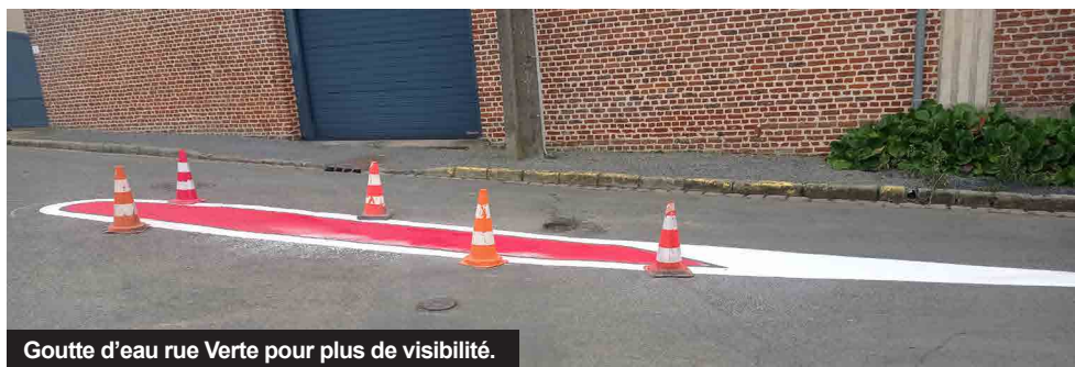
Goutte d'eau rue Verte pour plus de visibilité.