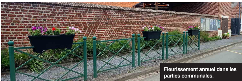
Fleurissement annuel dans les parties communales.