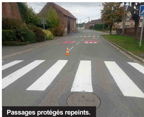
Passages protégés repeints.