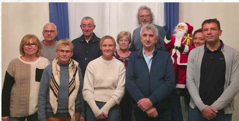
Réception de fin d'année aux bénévoles de la Bibliothèque et au Personnel.