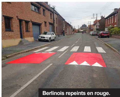
Berlinois repeints en rouge.