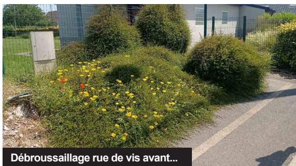
Débroussaillage rue de vis avant...