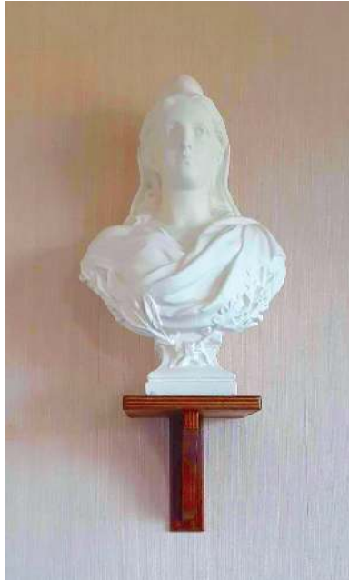
Réfection : Yves Clairnet

Salle des mariages, notre Marianne a fait peau neuve.