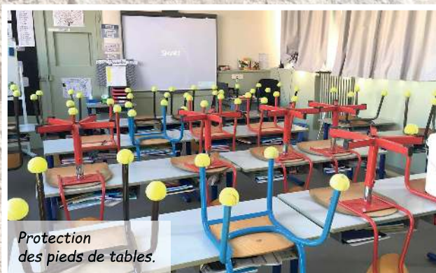
Protection des pieds de tables.