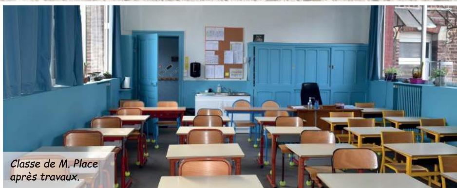
Classe de M. Place après travaux.