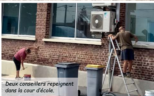
Deux conseillers repeignent dans la cour d'école.