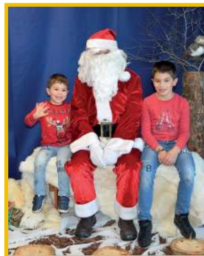
Les masques ont été retirés uniquement pour la prise photos.