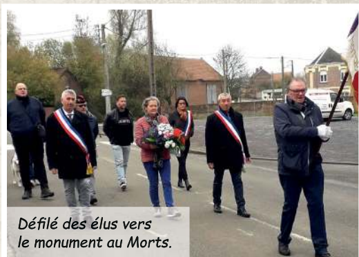
Défilé des élus vers le monument aux Morts.