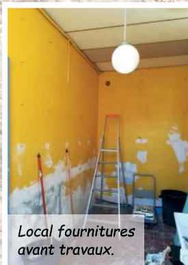
Local fournitures avant travaux.