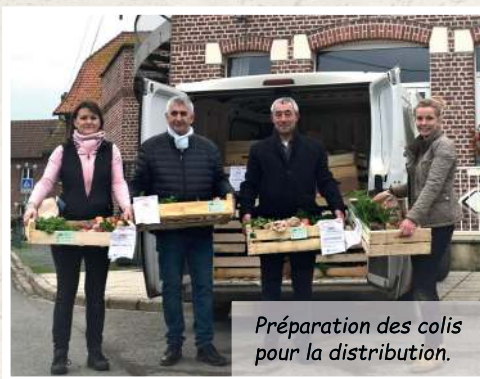
Préparation des colis pour la distribution.